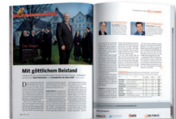
Beispiel aus 02/2012

Als Teilnehmer des Wettbewerbs erhalten Sie €uro ein Jahr lang kostenlos.