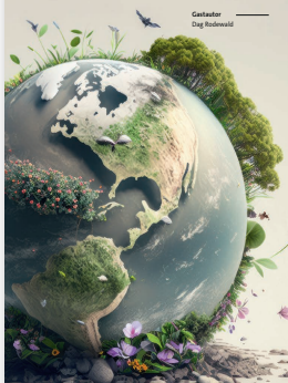
Grafiker: Dag Redwood

Auch im Rentenbereich gibt es heute zahlreiche nachhaltige Investitionsmöglichkeiten – darunter Anleihen multilateraler Entwicklungsbanken, Green Bonds und Papiere ESG-geprüfter Staaten.