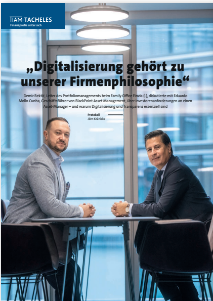
TIAM TACHELS